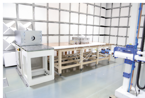
CISPR 25:2016 Ed.4 Annex I対応 固定型ダイナモ搭載電波暗室「EHV Chamber」

ULは、長年に渡る多様なレーザー製品の評価経験に基づき、IEC 60825並びに米国FDA (CDRH)のレーザー製品安全要求事項への適合性評価サービスを提供します。